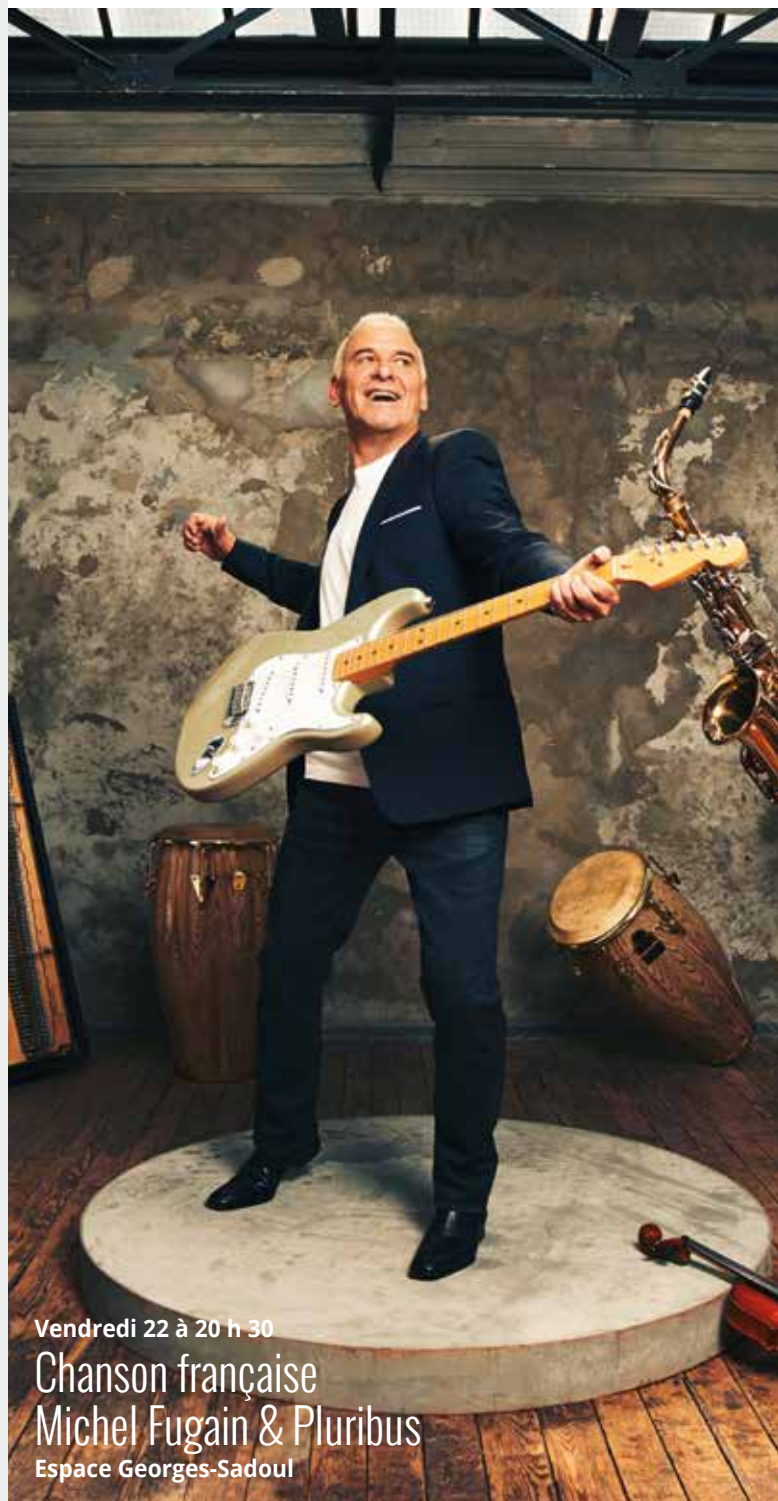
Vendredi 22 à 20 h 30 Chanson française Michel Fugain & Pluribus Espace Georges-Sadoul