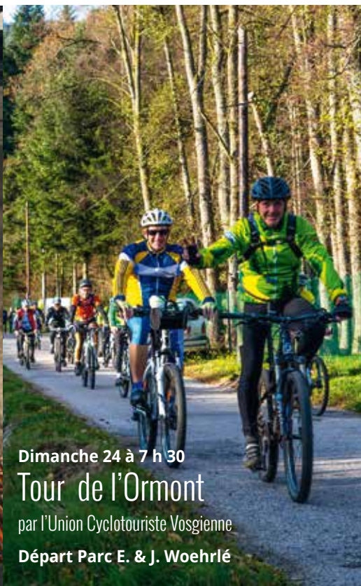
Dimanche 24 à 7 h 30 Tour de l'Ormont par l'Union Cyclotouriste Vosgienne Départ Parc E. & J. Woehrlé