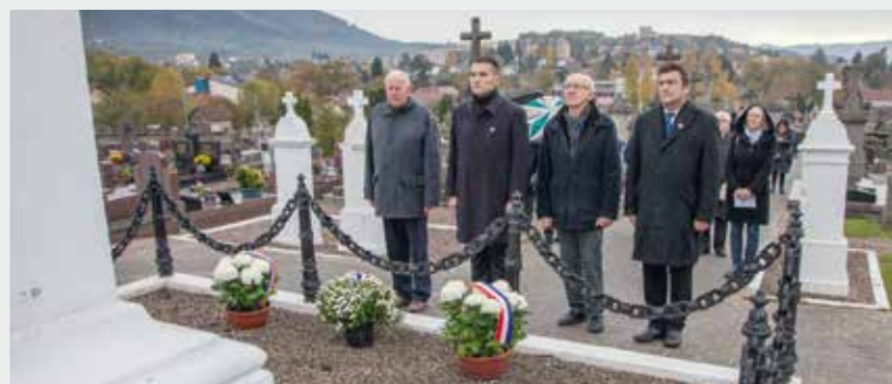
◀ Devoir de mémoire Le jour de la Toussaint, le Maire, accompagné de plusieurs élus, s'est recueilli à Colroy-la-Grande où repose l'ancien ministre Maurice Lemaire, puis à Hurbache sur la tombe de l'ancien conseiller général Joseph Schaefer. Des sépultures des cimetières de la ville, où sont inhumés des personnages emblématiques et des soldats morts pour la France, ont ensuite été visitées.