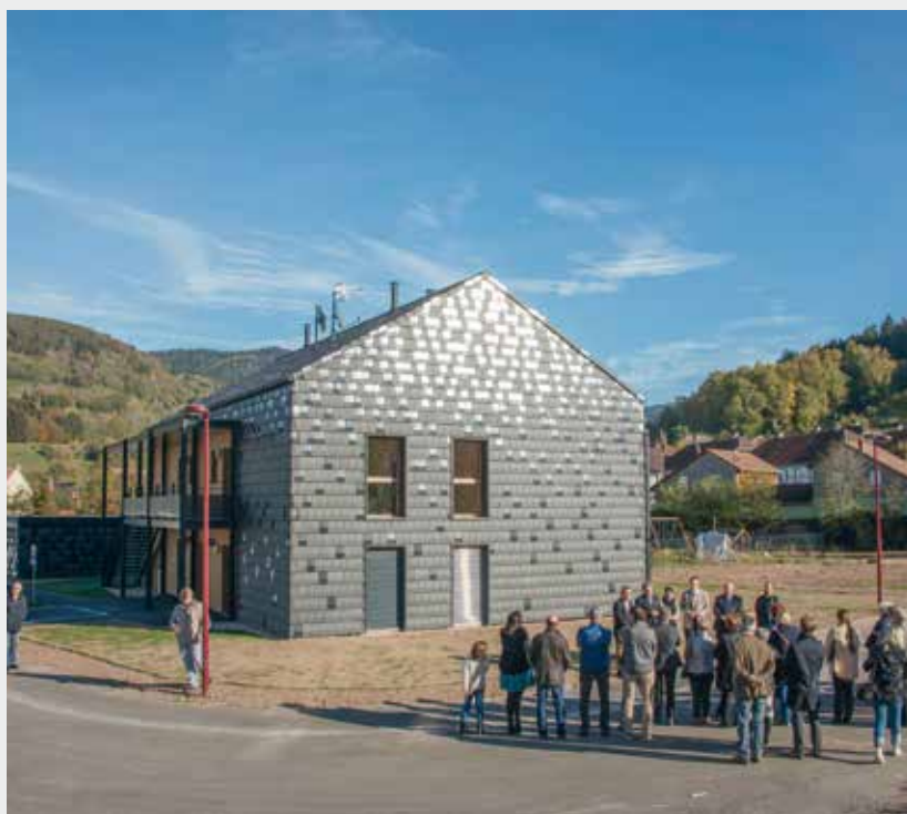
▲ Inauguration d'un bâtiment social passif Un bâtiment collectif de quatre logements, construit avec paille, bois et tuiles, réalisé par le bailleur social le Toit Vosgien, a été inauguré à Plainfaing. Moyennant un investissement de 697 000 euros (en partie réalisé grâce à un emprunt pour lequel la Communauté d'Agglomération s'est portée caution), ce type de construction est conçu pour permettre des charges réduites de 90 %, avec une consommation inférieure à 15 kw heures.