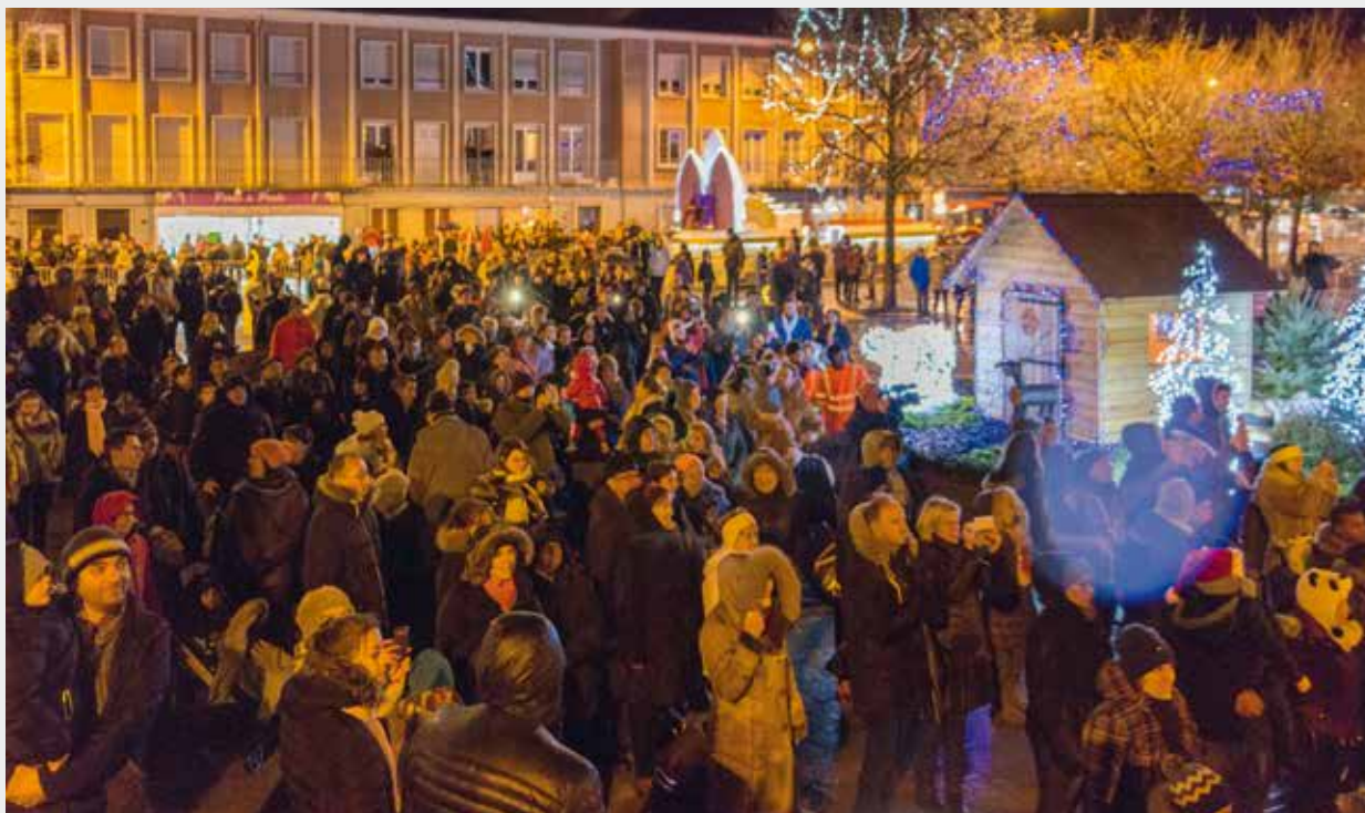
◀ Saint Nicolas ne craint pas l'eau du ciel ! La pluie n'effraie pas le pèlerin... et pas davantage le saint patron des Lorrains ! Pour preuve si besoin en était, après avoir visité les écoles, saint Nicolas a bravé un véritable déluge porté par des bourrasques hivernales pour participer à la parade promise au centre-ville. De beaux chars, des fanfares composaient le cortège imaginé par vingt-six associations issues de la ville et de communes de l'agglomération de Saint-Dié-des-Vosges.