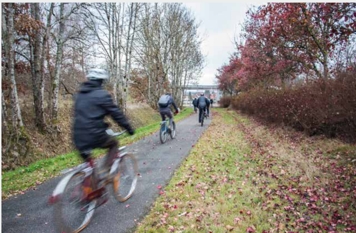
▶ Voie verte Récemment inaugurés, 850 mètres d'un nouveau tronçon permettent de relier la voie verte intercommunale qui s'arrêtait sur la commune de Moyenmoutier à la gare SNCF d'Étival. Un plus pour l'écologie et la lutte contre le réchauffement climatique puisqu'il est dès à présent possible, pour les personnes en capacité de le faire, d'aller à pied ou à vélo prendre le train vers Nancy ou Saint-Dié-des-Vosges.