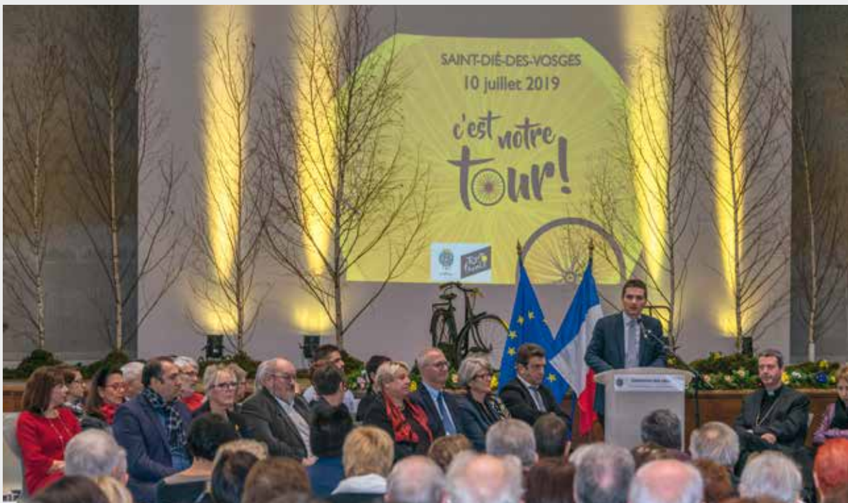
◀ 2019, pour imaginer la ville et le territoire de demain Plus de 500 personnes ont assisté, à l'Espace François-Mitterrand, à la traditionnelle cérémonie des vœux de David Valence. Les enjeux définis par le Maire de Saint-Dié-des-Vosges ont invité tous et chacun à contribuer à une ville plus verte, plus solidaire, courageuse, fière de ses atouts et qui, entre autres, se réjouit d'avoir la chance extraordinaire d'accueillir le Tour de France en juillet !