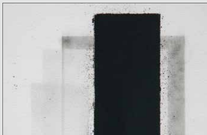
Détail d'une œuvre présentée

DESIGNER D'INTÉRIEUR CHEMINÉES Daniel PERRIN & Fils