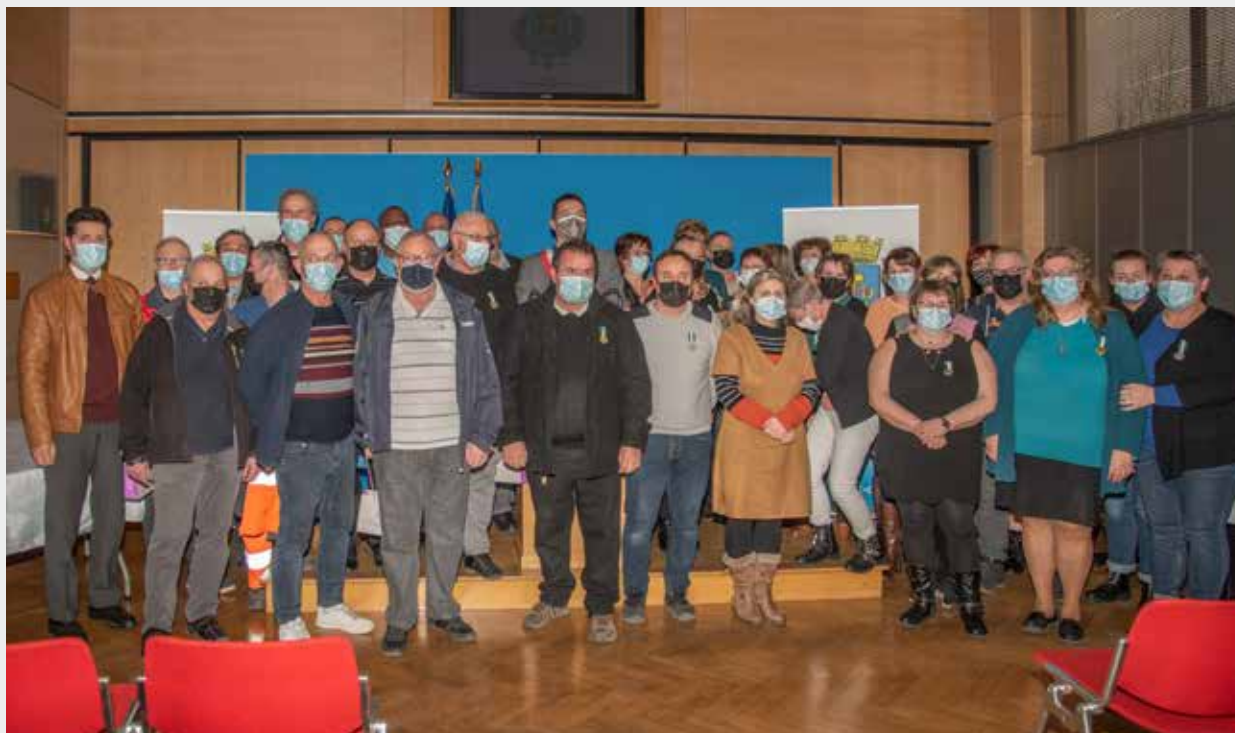
◀ De l'argent, du vermeil et de l'or Des médailles d'honneur régionales, départementales et communales, d'argent pour 20 ans, de vermeil pour 30 ans, et d'or pour 35 ans de travail, ont été officiellement remises à des salariés de la Ville de Saint-Dié-des-Vosges. Cette cérémonie organisée à l'hôtel de ville, concernait la promotion de l'année 2022, mais aussi celles de 2020 et de 2021 retardées du fait de la pandémie.