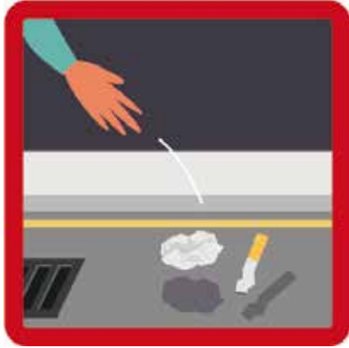
Jet de cigarette et de papier sur l'espace public Amende : 135 euros