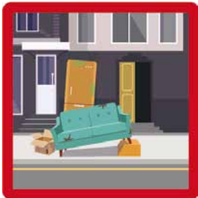
Encombrants laissés sur le bord des voies de circulation sans autorisation Amende : 135 euros