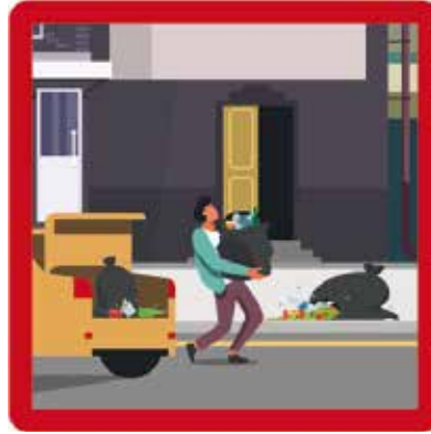
Abandon de déchet à l'aide d'un véhicule sur la voie publique Amende : 1 500 euros maximum et possibilité de confiscation du véhicule