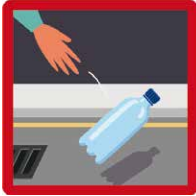
Jet de bouteilles sur l'espace public Amende : 135 euros