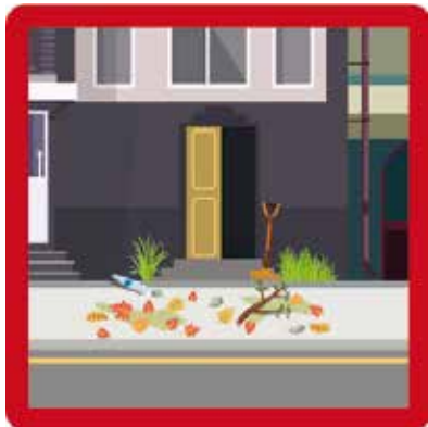
Absence de balayage et d'entretien devant son domicile Amende : 150 euros (arrêté municipal)