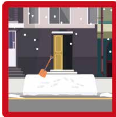
Absence de déneigement du trottoir situé devant son habitation Amende : 150 euros (En cas d'accident, la responsabilité des riverains peut être engagée pour négligence.)