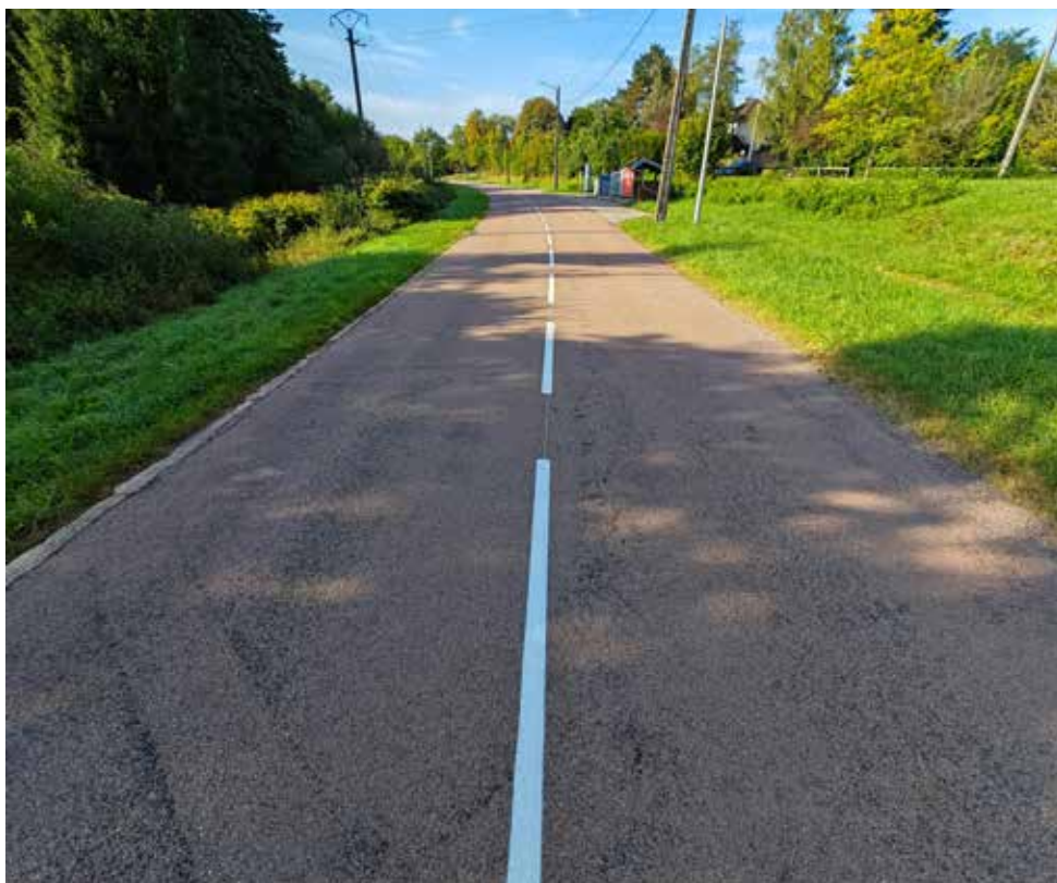
Le marquage a été refait avenue de Robache

Foucharupt, Marzelay, Le Villé : 28 novembre et 26 décembre. ●