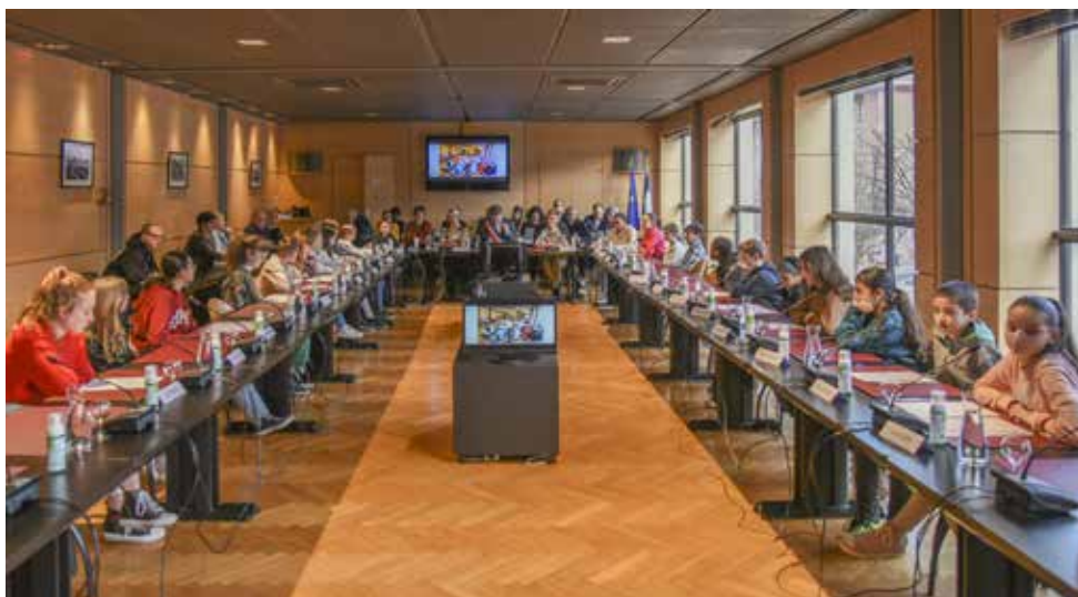
Le Conseil Municipal des Jeunes se renouvelle