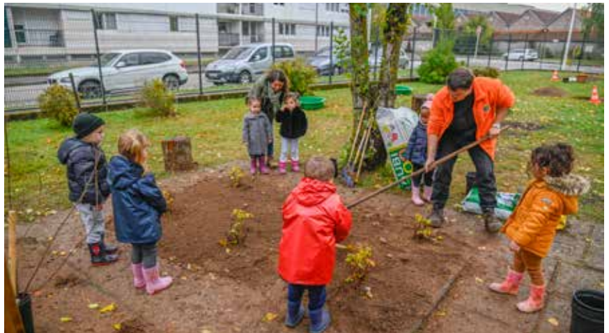
Fin de chantier à l'école Claire-Goll

L es derniers coups de pelle ont été donnés le jeudi 19 octobre au matin, par quelques-uns des 99 élèves : l'école maternelle Claire-Goll est désormais végétalisée ! Plus que ça, même, puisque de petits fruitiers ont été plantés, de même qu'un cerisier pollinisateur, un châtaignier, un pommier, deux liquidambers, le tout pensé par le service Parcs et Jardins de la Ville. Voilà pour une partie de la cour de l'école. De l'autre côté d'un portillon tout neuf, place aux jeux avec une structure trois toboggans et un pont de singe et de quoi s'amuser également sur les quelque 900 m 2 recouverts d'herbe, d'enrobé drainant ou encore de stabilisé renforcé. La cour de l'école a également été sécurisée par un