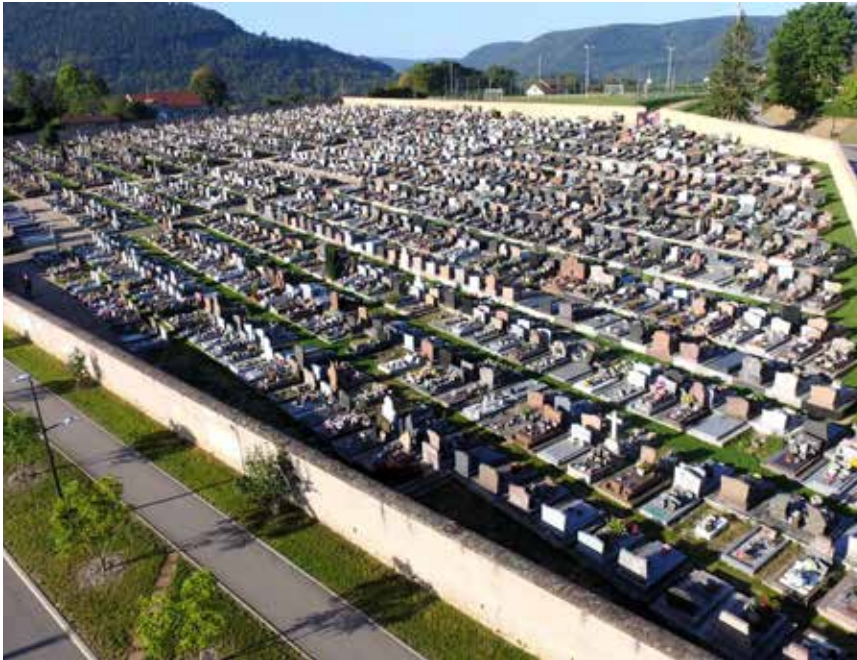
Les cimetières passent au vert

Un plan de végétalisation pour les deux cimetières communaux a été lancé l'an dernier.