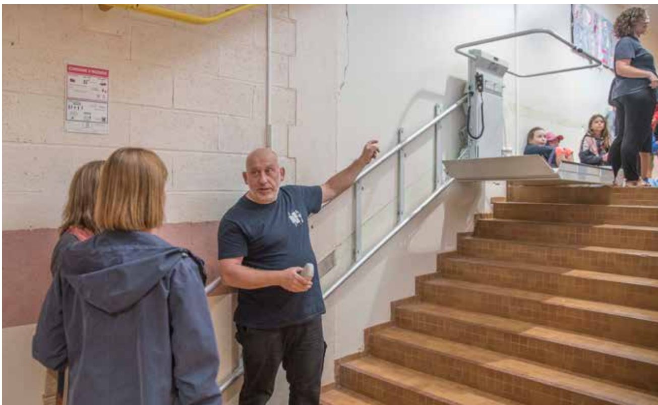
Des élévateurs sont installés dans les établissements recevant du public (ERP) dont l'étage est inaccessible aux personnes à mobilité réduite