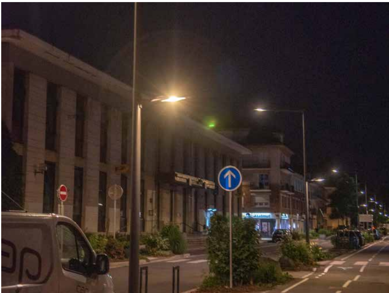
L'ensemble de l'éclairage public déodatien sera doté d'ampoules à leds d'ici 2032