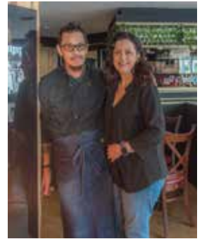
Un nouveau restaurant a ouvert ses portes

Ouvert du lundi au samedi de 7 h à 21 h et le dimanche de 9 h à 13 h ●