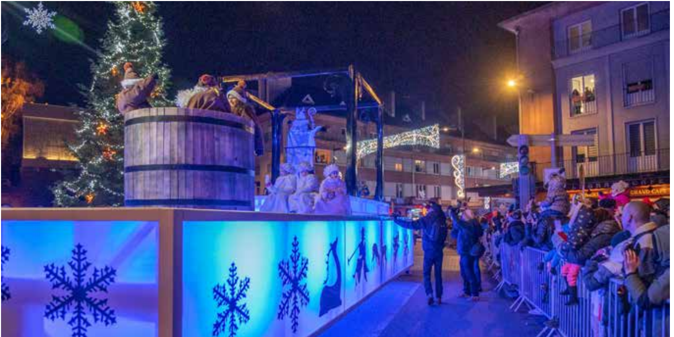
Le défilé de Saint-Nicolas traversera le centre-ville