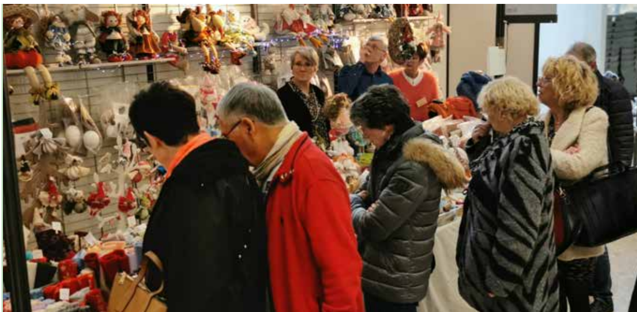
Le salon des Loisirs Créatifs sera une nouvelle fois au programme de novembre