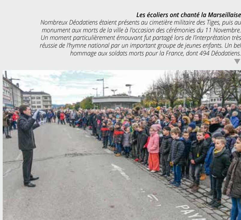
Les écoliers ont chanté la Marseillaise Nombreux Déodatien étaient présents au cimetière militaire des Tiges, puis au monument aux morts de la ville à l'occasion des cérémonies du 11 Novembre. Un moment particulièrement émouvant fut partagé lors de l'interprétation très réussie de l'hymne national par un important groupe de jeunes enfants. Un bel hommage aux soldats morts pour la France, dont 494 Déodatien.