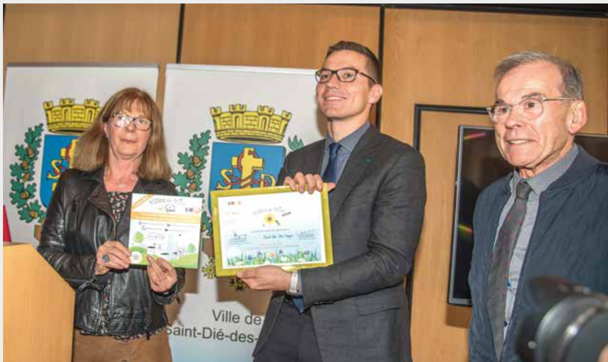
◀ Un 1 er prix national pour le miel déodatien ! Le combat conduit pour favoriser la biodiversité en ville s'est concrétisé par l'obtention d'un 1 er prix national pour le miel urbain 2018 de Saint-Dié-des-Vosges. La remise de ce prix, remporté parmi une sélection de 46 miels a été effectuée le 30 octobre en mairie.