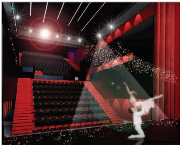
Non, vous ne rêvez pas : Sadoul pourra accueillir de la danse...