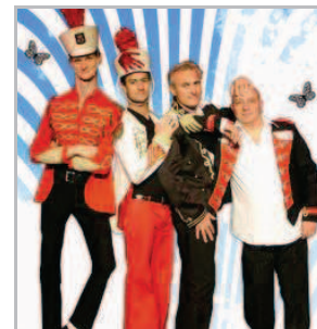
Les Zablocks, un condensé du savoir-faire belge.