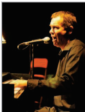
Hommage à Nougaro par Pierre-Eric Rousseaux.