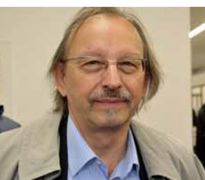
Didier Daeninckx, ami fidèle du FIG, a une nouvelle fois honoré le Salon du Livre de sa présence