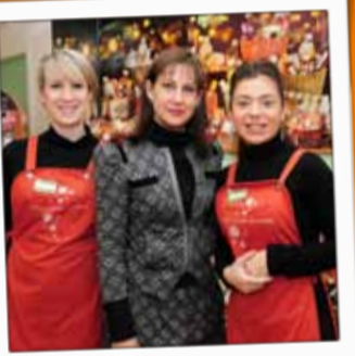
YVES ROCHER Parfumerie, esthétique 27, rue Thiers