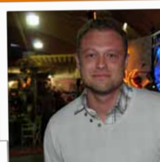
VIVE LE JARDIN Grande surface spécialisée jardin 23, avenue de Verdun