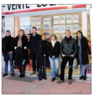
ORPI IMMOBILIER Agence immobilière 3, rue Thiers

C'est bien connu : la première vitrine d'un commerçant et d'un artisan, c'est son sourire ! Cafetier ou boulangère, agent d'assurances ou fleuriste, opticien ou coiffeuse, restauratrice ou concessionnaire auto... Membres de l'UDAC, quels que soient vos spécialités et vos domaines d'expertise, c'est vous, d'abord, qui incarnez pour les clients les produits et services que vous commercialisez. Vous êtes les visages de la dynamique du commerce et de l'artisanat à Saint-Dié-des-Vosges. A travers ce petit «trombinoscope», que vous pourrez conserver sous la main, retrouvez en toute simplicité les différents adhérents de l'Union Déodatienne des Artisans et Commerçants.