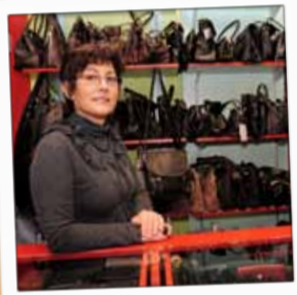
LA TANNERIE Maroquinerie 11, rue Thiers