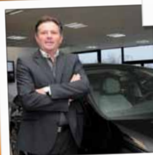
BSA AUTOMOBILE Concession automobile / Citroën Av. de l'Egalité - Hellieule2