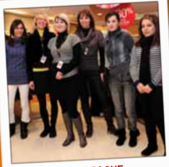
CACHE CACHE Prêt-à-porter féminin 35, rue Thiers