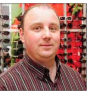
OPTIC 2000 Opticien 9, quai Maréchal Leclerc