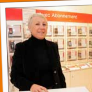
ESPACE PÔLE COMMUNICATION Téléphonie 22, rue Thiers