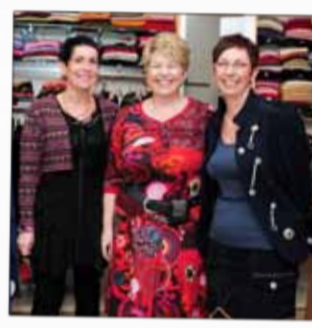
BULITT Prêt-à-porter féminin 39, rue Thiers