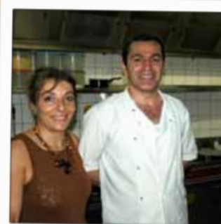
AUX DELICES D'ANATOLIE Restauration rapide turque 25, rue Joseph Mengin