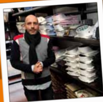
FIARINO Prêt-à-porter masculin 25, rue Thiers