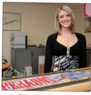
FRANCE BOISSONS Distributeur de boissons 103, rue d'Alsace