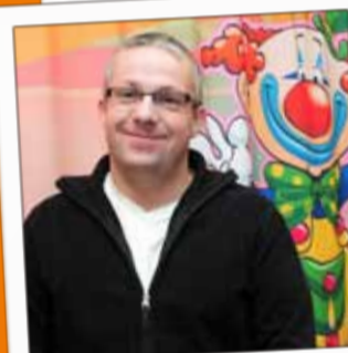
LA PISTE DE ZIM Animations pour enfants 48, rue du 12 ème Régiment d'Artillerie