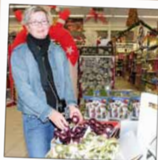
LA FOIR'FOUILLE Grande surface spécialisée bazar 2, rue Emile Durkheim