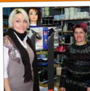
BEAUTY COIFF Matériel, accessoires pour coiffure 4, rue Mathias Ringmann