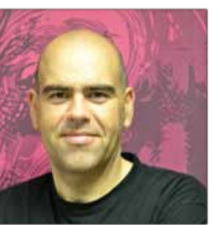
PLUS 6 Communication et publicité 9, rue d'Epinal