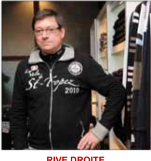
RIVE DROITE Prêt-à-porter masculin 47, rue Thiers