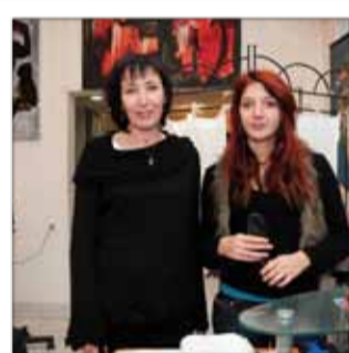
FABIENNE TARUFFI COIFFURE Coiffure 6, rue Concorde