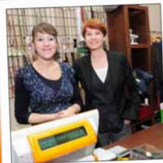
BIENSÛR Prêt à porter féminin 16, rue Dauphine