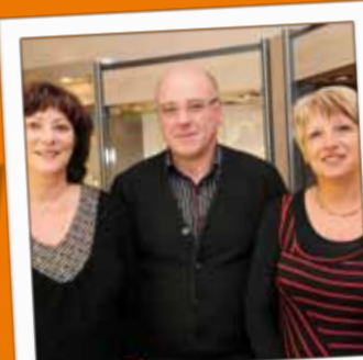
BIJOUTERIE IUNG Bijouterie 7, rue Thiers