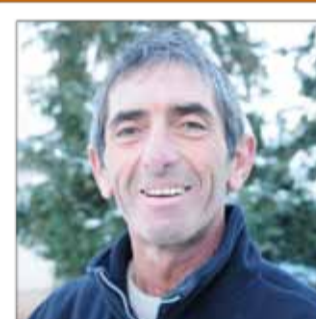
CASSIS FRAMBOISE Boulangerie pâtisserie traiteur 35, rue Stanislas