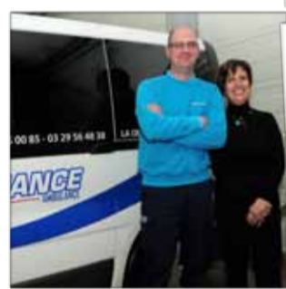
ALLIANCE AMBULANCES Ambulances 4, rue Marie Marvingt