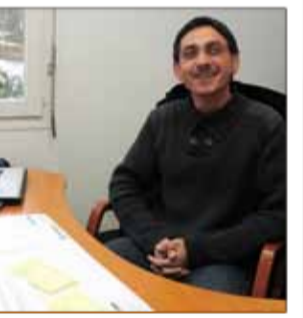
CAP FRANCE «LA BOLLE» Séjours vacances hébergement 34, chemin du Réservoir