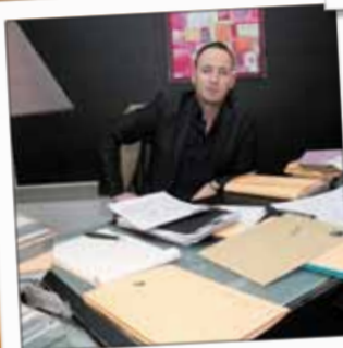
AXA ASSURANCES Agent d'assurances 15, quai Maréchal Leclerc