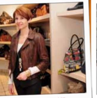
BOUTIQUE FAUVE Chaussures 45, rue Thiers