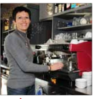
HÔTEL BAR LE GLOBE Hôtel bar 2, quai Maréchal de Lattre de Tassigny