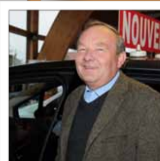
GARAGE CHARAUD Concession automobile / Opel - Honda Route de Colmar