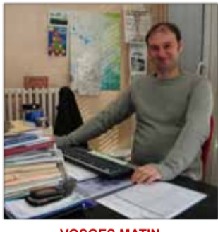
VOSGES MATIN Presse quotidienne régionale 31, rue Thiers