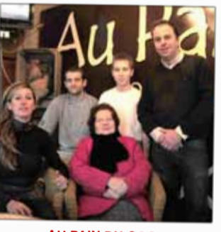
AU PAIN DU COQ Boulangerie Place Saint-Martin