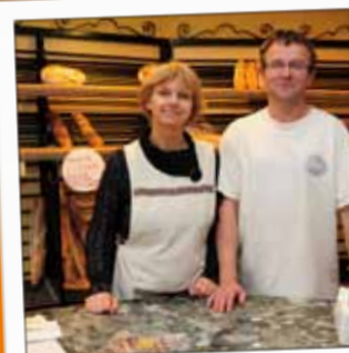
BOULANGERIE GÉRARD Boulangerie 62, rue de la Bolle