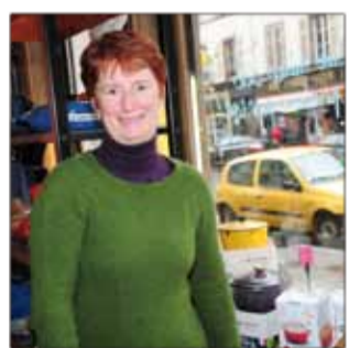
DEDENON-BEAU Quincaillerie 1, rue Gambetta