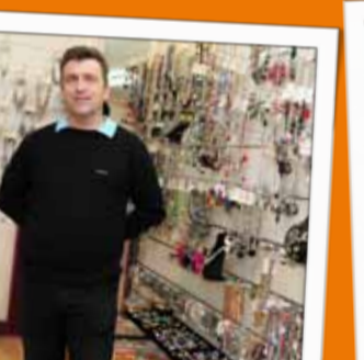
PERLE À PERLE Perles, bijoux, bonbons 13, place du Général de Gaulle