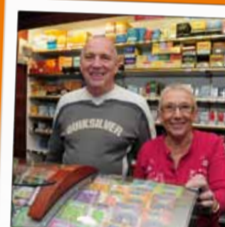
AU BON ACCUEIL Bar tabac 64, rue de la Bolle