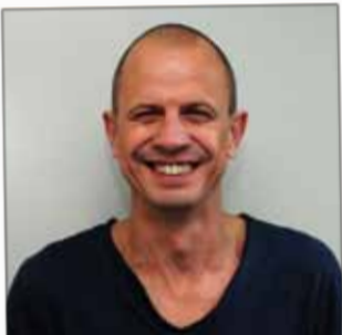
PHARMACIE MICHEL Pharmacie 18, rue Thiers