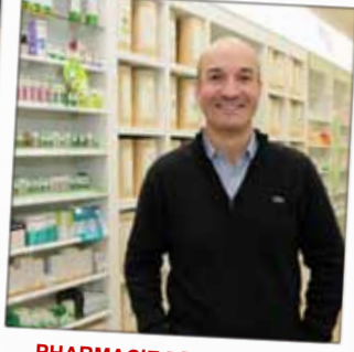
PHARMACIE DE LA POSTE Pharmacie 10, rue Dauphine