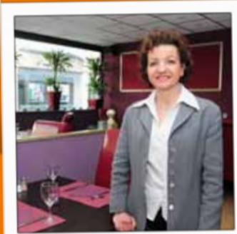
CAFÉ RESTAURANT DE LA TOUR Restaurant Allée Emile Lambert