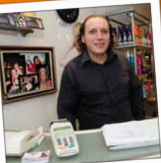
RENAUD COIFFURE Coiffure 5, rue de la Bolle