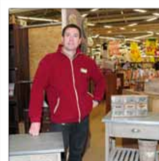
M e BRICOLAGE Grande surface spécialisée bricolage Rue A. de Saint-Exupéry - Hellieule2