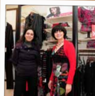
SCOTTAGE Prêt-à-porter féminin 10, rue Stanislas