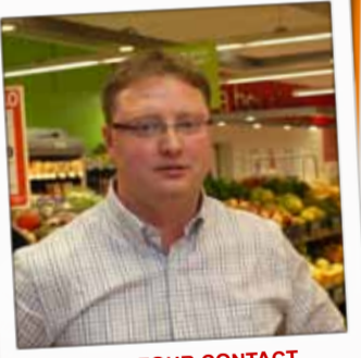
CARREFOUR CONTACT Supermarché Place des Déportés