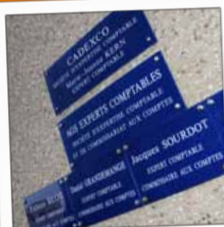
AGS EXPERTS COMPTABLES Expertise comptable 12, rue Emile Durkheim