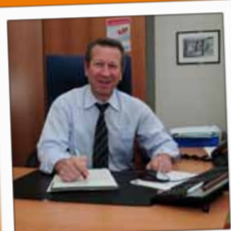
SOCIÉTÉ GÉNÉRALE Banque 2, rue Gambetta