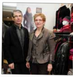
EMRIC Prêt-à-porter mixte 23, rue Thiers