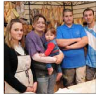
BOULANGERIE MERX Boulangerie 58, rue des Travailleurs