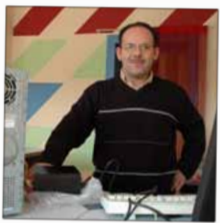
MICRONODES INFORMATIQUE Informatique 14, rue Baldensperger