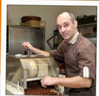
CHOCOLATS CARL Chocolatier 6, rue Thiers