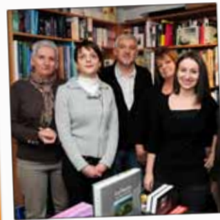
LIBRAIRIE LE NEUF Librairie 5, quai Maréchal Leclerc