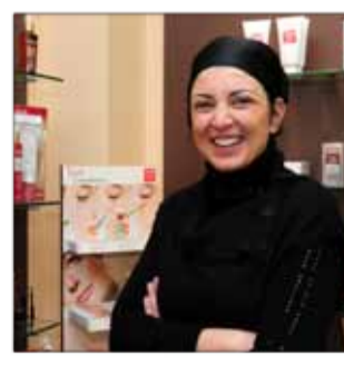
INSTITUT CLAUDIE Esthétique 47, rue d'Alsace