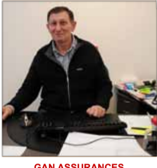
GAN ASSURANCES Agent / assurance 17, rue Thiers