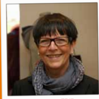
LA FOULLERIE Prêt-à-porter féminin 24, rue Thiers