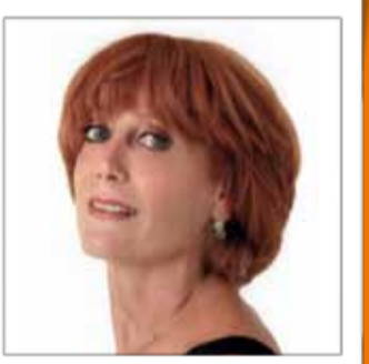
COIFFURE ANNIE DENTAN Coiffure 45, rue Thiers