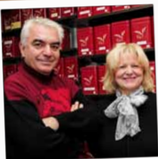
ARÔMES ET TENDANCES Thé et café 9, quai Maréchal Leclerc