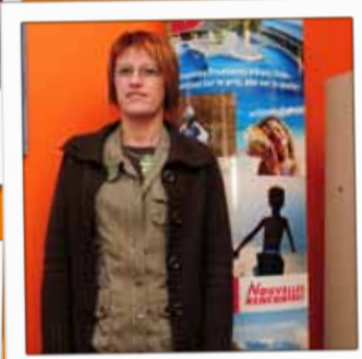
PRÊT À PARTIR Agence de voyages 44, rue Thiers