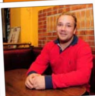
LONDON TAVERNE Bar 16, rue Joseph Mengin