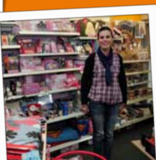
LA PAPÉTHÈQUE Papeterie 5, rue Thiers