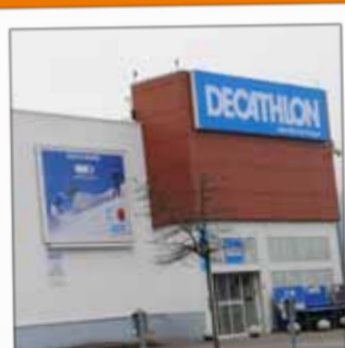
DECATHLON Grande surface spécialisée sports Av. de l'Egalité - Hellieule2