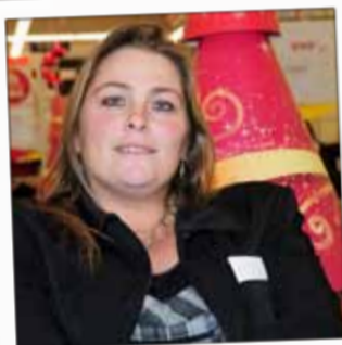
CONFORAMA Ameublement Av. de l'Egalité - Hellieule2