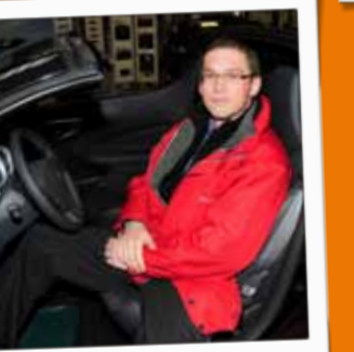
SAINT-DIÉ EVOLUTION Concession automobile / Renault - Dacia 52, rue de la Bolle