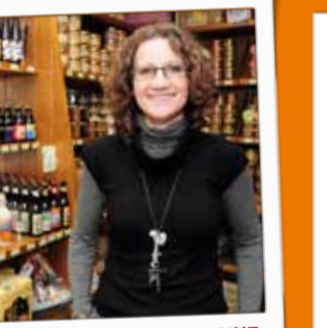
EN PASSANT PAR LA LORRAINE Produits de Lorraine Quai Maréchal de Lattre de Tassigny