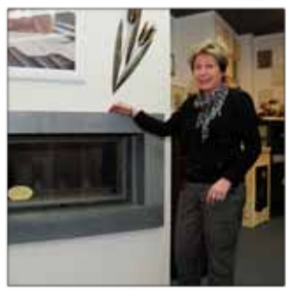
CHEMINEES-DANIEL PERRIN Cheminées Poêles Faïences 13, quai Maréchal Leclerc