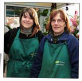
MIDI FLEURS Fleuriste 8, place Saint-Martin