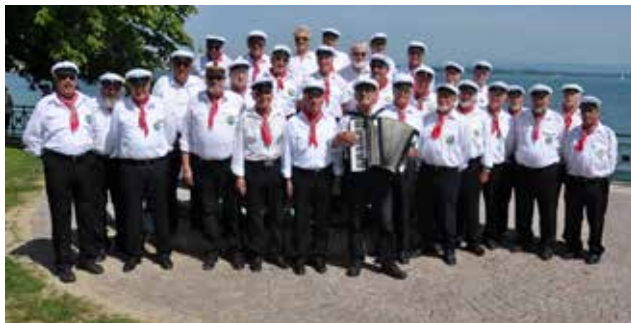
Le Chœur des Marins de Friedrichshafen, en grand équipage, au bord du lac de Constance

Une délégation de chanteurs du Chœur des Marins de Friedrichshafen (ville allemande jumelée avec Saint-Dié-des-Vosges) se propose de partager son répertoire avec des chants de marins aussi bien que quelques chansons françaises et des standards européens.